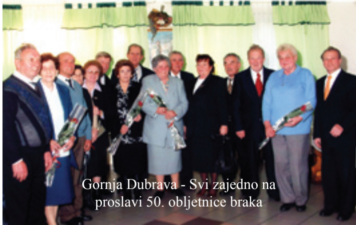
Gornja Dubrava - Svi zajedno na proslavi 50. obljetnice braka

U 2004. godini Podružnica umirovljenika Donji Kraljevec imala je 534 člana, a u Kasu uzajamne solidarne pomoći bilo je učlanjeno 300 članova.