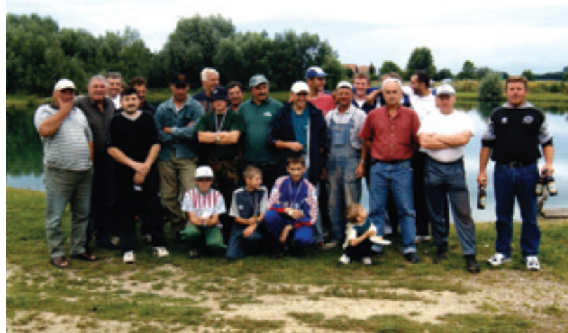
Društveno natjecanje na Tratama 11.07.2004.

Vrhunac druženja u obliku izleta bilo je hodočašće u Međugorje. Kako kažu, obzirom da fizičko blagostanje članovi ostvaruju u sportskoj dvorani, duhovno blagostanje ostvarili su u Međugorju. Kući su se vratili s velikim veseljem, mirom u srcu i puni elana za sve u vezi s poduhvatima u narednom razdoblju.