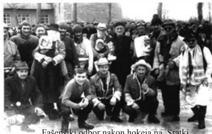
Fašenski odbor nakon hokeja na Sratki

Dosadašnje izložbe koje je priredio Aktiv, pokazale su da je Donji Pustakovec jedna velika riznica blaga - kako starinskog pribora, oruđa, alata, opreme, tako i narodnih nošnji, posebno same izrade tradicionalnih rukotvorina, specifičnih za D. Pustakovec. Samo se OVDJE izrađivala tako lijepa jabuka za zastavu, cimeri za svate i bandiste,