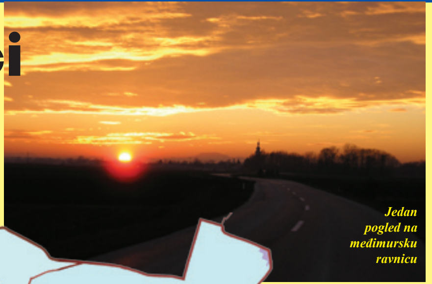
Jedan pogled na međimursku ravnicu