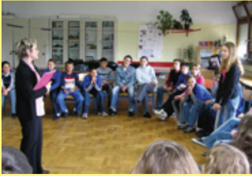
Svoj dan međimurski Crveni križ obilježio je u Osnovnoj školi Hodošan.