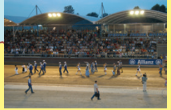
Još nismo svjesni veličine i vrijednosti jednog "Milenijuma"