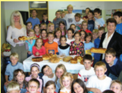
Dane kruha i zahvalnosti obilježili su učenici diljem općine i župa