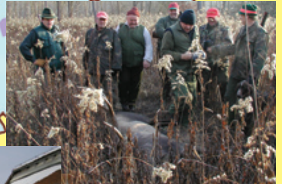
Vidljivo zadovoljstvo članova "Srnjaka" nakon ulova.