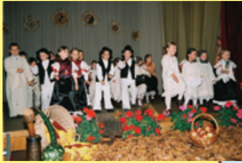
Najmlađi folklorši nude obilje radosti gdje god se pojave