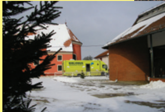
Bibliobus je uvijek kao ura točan! Djeca ga vole, a odrasli ga se boje!