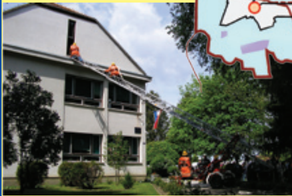
Vatrogasna vježba "OŠ Donji Kraljevec 2005." okupila je vatrogasce cijele Zajednice općina