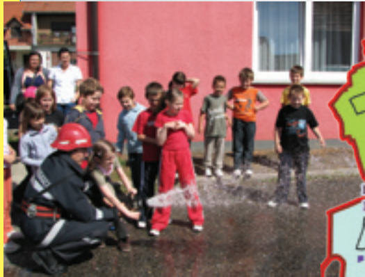
DVD Hodošan ističe se radom s namladima - gosti su stigli čak iz Čakovca!