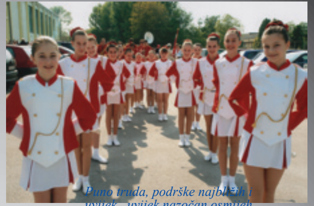
Puno truda, podrške najbližih i uvijek, uvijek nazočan osmijeh mladim mažoretkinjama otvorio je vrata Europe