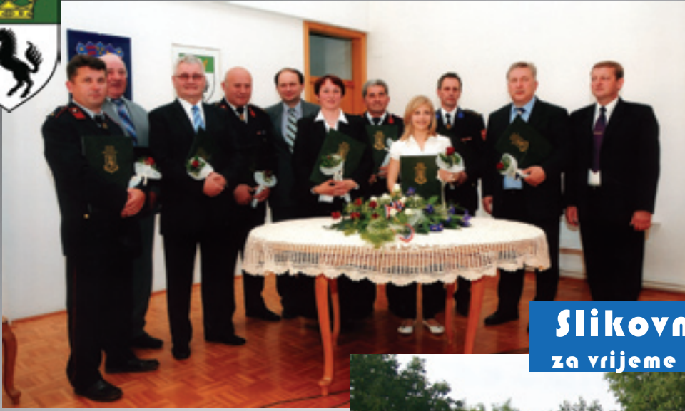
Dobitnici općinskih priznanja za svibanjske Dane općine