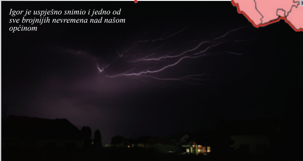
Igor je uspješno snimio i jedno od sve brojnijih nevremena nad našom općinom