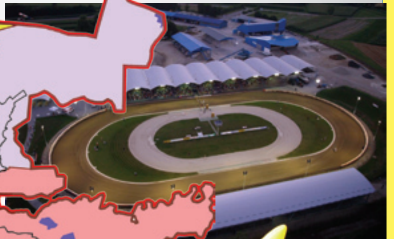
Stadion Milenium - nova prava i velika europska destinacija