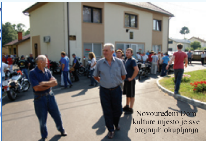
Novouređeni Dom kulture mjesto je sve brojnijih okupljanja

Nakon značajnog uređenja Doma kulture u 2007. i 2008. godine ove godine ugovoreni su radovi na uređenju fasade. Proveden je postupak nabave ograničenim postupkom. Radove je izvodila firma COLOR CENTAR d.o.o. Prelog, za iznos od 48.784 kuna (bez PDV-a).