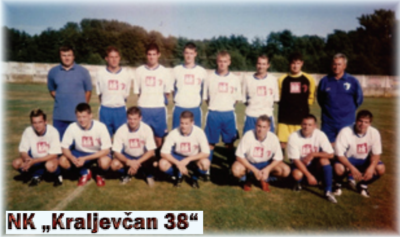
NK „Kraljevčan 38“

NK „Kraljevčan 38“ ni ove godine nisu baš cvale ruže. Još uvijek teško vozimo u Trećoj županijskoj ligi Istok. Na proljeće u sezoni 2008./09. od jedanaest ekipa zauzeli smo pretposljednje mjesto (20 4 1 15 29 : 63 13). Kako je vidljivo iz predočenih rezultata u čitavoj sezoni postignute su samo 4 pobjede. Juniori su se plasirali na solidno 3. mjesto (20 13 1 5 97 : 51 40), a mladi pioniri na 3. mjesto od osam ekipa (14 9 2 3 75 : 20 29) što je isto svakako dobar plasman. Sav teret oko vođenja kluba spao je na samo tri do četiri člana, a to je za svaku osudu i žalosno. Korijeni svega toga što se zbiva i dešava u društvu svima je poznati i objašnjeni u prošlim Godišnjacima pa ih ne bi ponavljali i ove godine. Uprava je samo na papiru (da barem dođe netko od njih na utakmicu). Gledatelja gotovo i nema. Nema sastanaka, nema izvještaja, nema godišnjih skupština. Prvu ekipu i nadalje vodi igrači i predsjednik Zdenko Percač. A, „Katica za sve“, Bruno Glavak vodi juniore i sve ostale poslove oko igrališta. Dražen Hranjec muke muči s pionirima, jer tko se od njih pokaže malo boljim, odmah „tobože“ odlazi u drugu, „bolju“ sredinu. Dobro je da u prilikama oko šanka priskače u pomoć Momčilo Radmanović. Nekad najljepši teren i stadion u našoj okolici prepušten je propadanju.