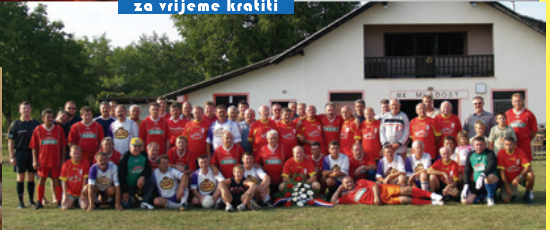
Tradicija godišnjeg okupljanja članova NK Mladost se nastavlja. Opet stari i mladi na teškom poslu loptanja...