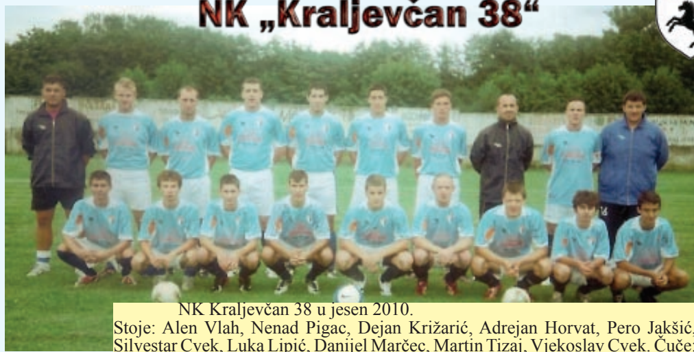
NK Kraljevcan 38 u jesen 2010.