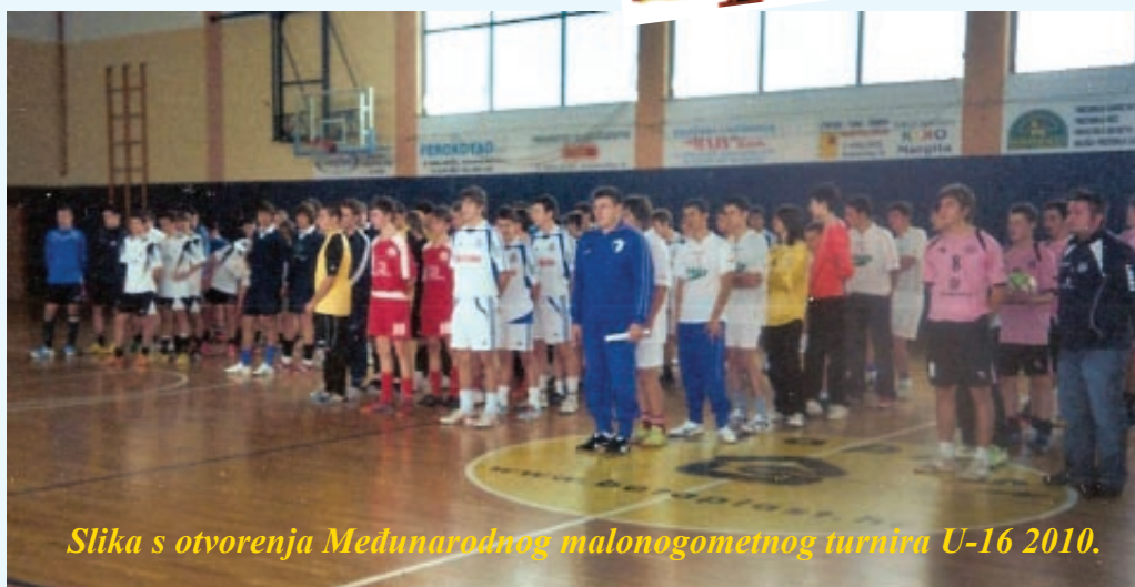
Slika s otvorenja Međunarodnog malonogometnog turnira U-16 2010.

Nakon cjelodnevnog natjecanja u polufinalne borbe plasirali su se (Slaven-Belupo - Mura 005 2:6) i (Podravina - MAV -NTE 1886 2:2, penali 6:5). U borbi za 3. mjesto Slaven -Belupo je pobijedio MAV-NTE 1866 sa 1:0, u finalu rezultata 2:2 Podravina je na penale 7:5 osvojila naslov prvaka U-16 2010. Najbolji strijelac s 8 golova bio je Dario Čanadžija, najbolji igrač Dario Trunjski iz Podravine, a najbolji golman Safer Jaka iz Mure Murska Sobota. Kao i svake godine organizacija turnira bila je na vrhuncu, za svaku pohvalu. Poželimo im da se tako u lijepom ambijentu sve ponovi dogodne. (Vilko Šercer)