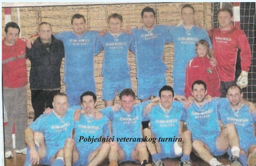
Pobjednici veteranskog turnira