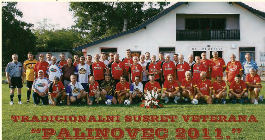
TRADICIONALNI SUSRET VETERANA "PALINOVEC 2011."

Na kraju svim simpatizerima, mještanima Palinovca, te svim žiteljima naše općine želimo puno zdravlja, te sretan Božić i uspješnu novu 2012. godinu. (Franjo Jančec)