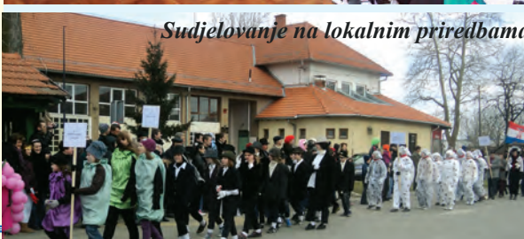
Sudjelovanje na lokalnim priredbama