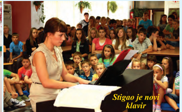
Stigao je novi klavir