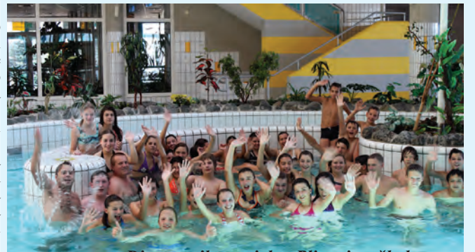
Dio mozaika projekta Plivanje u školama

Škola ne preskače ništa, već vrijedno radi i gradi na svom osnovnom odgojnom i obrazovnom poslanju. U tijeku je reorganizacija školske uprave i novo održavanje Arhive škole. Počinje se raditi na novim računalnim sustavima i programima. Više djelatnika polaže ili su upućeni na polaganje zahtjevnih stručnih ispita. Zaposleni su novi djelatnici - od suradnika u nastavi do tehničkog osoblja. Početkom godine Škola kreće u ostvarivanje prava na vlastiti prostor, projektiranje novih zahvata za sigurniji i ugodniji boravak učenika i zaposlenih tijekom nastave.