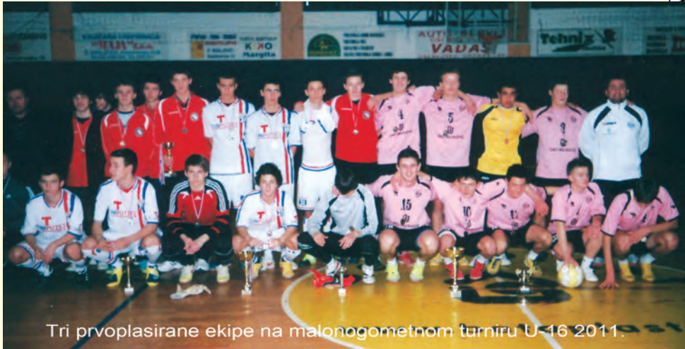
Tri prvoplasirane ekipe na malonogometnom turniru U-16 2011.

A skupina: „Termiti“ Prelog, „Fontana“ Donji Kraljevec, „Iskusni jahači“ Donji Kraljevec, „Veterani – Sloga“ Koprivnički Ivanec, „Euroklima“ Goričan i „Mefisto“ Otok. B skupina: SIZIM Veliki Otok, „Veterani“ Donji Kraljevec, „Veterani“ Hodošan, AC „Jasenović“ Čakovec, „Toni d.o.o.“ Donji Kraljevec i HVIDRA Prelog-Čakovec. Igralo se na bod sistem. Nakon razigravanja najbolje ekipe su se plasirale u finalne borbe. U zaista žustrim i lijepim borbama 1. mjesto osvojila je ekipa „Veterani“ iz Hodošana, 2. mjesto „Toni d.o.o.“ iz Donjeg Kraljevca i 3. mjesto SIZIM iz Velikog Otoka. Na kraju treba pohvaliti odličnu organizaciju turnira i sretno im bilo dogodine. (Vilko Šerčer)