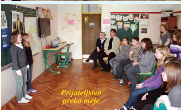
Prijateljstvo preko meje