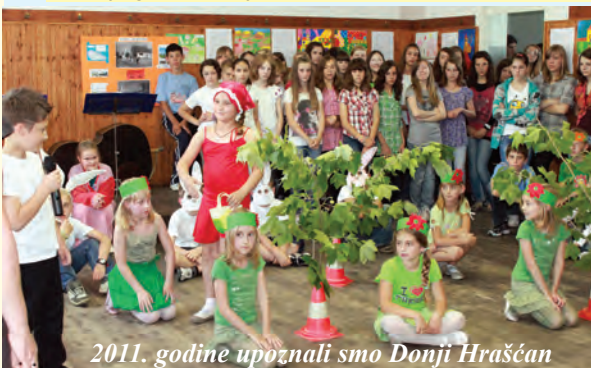
2011. godine upoznali smo Donji Hračćan

Učenici i njihove obitelji izvanredno dobro obavljaju svoje dužnosti, one koje moraju (škola) i one koje su dobrovoljno prihvatili (udruge). Bez naših učenika upitan bi bio rad KUD-a i većine DVD-a. Oni su ključni dijelovi ekoloških udruga, klubova mladih, ribolovnih društava, nogometnih klubova, budućnost sela, župe i šire. Dugo je trebalo da se pokažu rezultati predanog odgojno-obrazovnog rada naših djelatnika. Oni koji nas redovito prate (dolaskom tijekom nastave ili praćenjem preko interneta) znaju za veliku dnevnu odgovornost djelatnika naše Škole i koliko je znanja, strpljenja, dobrote potrebno da bi naši učenici bili manje problematični. Jer, druga su vremena, drugi su načini komunikacije, a globalno društvo je drastično povećalo razlike u imovinskom stanju i ponašanju učenika. Škola je često regulator problema koje bi trebale rješavati prvenstveno obitelji učenika. Svjesni smo također i svojih slabosti koje ne možemo odmah riješiti. Iz svega rečenoga jasno je da Osnovna škola Hodošan od svoje okoline očekuje barem onoliko koliko čini na svom području. Detalje o radu Škole uvijek možete potražiti na www.skola-hodosan.hr . Svim žiteljima općine Donji Kraljevec, učenicima, roditeljima i djelatnicima naše Škole, djelatnicima Općine Donji Kraljevec, vrijednim radnicima u našim tvrtkama i gospodarstvima od srca želimo sretan i blagoslovljen Božić te zdravu i uspješnu novu 2012. godinu!