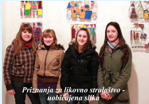
Priznanja za likovno stralaštvo - uobičajena slika

Osmijeh za osmijehom, vedrina, optimizam, zajedništvo, red i poštovanje među kolegama osvojili su me u roku odmah. Nakon prvotnog ushićenja, novi izazov predstavljalo je upoznavanje s učenicima. Velike oči pune interesa, spontanost, razigranost, iskrenost i odgovornost osobine su učenika ove škole. Osjećaj ispunjenosti i zadovoljstva jedino je što sam taj dan ponijela kući. Na povratku me iznenadilo krasno školsko okruženje pitajući se jesam li ovim putem ušla u školu. Naravno da jesam. Je li to bio samo jedinstveni prvi dojam? Nije. I danas, nakon suočavanja sa svim aspektima svoga rada, mogu reći da osjećaj ispunjenosti i zadovoljstva u radu s kolegama i učenicima ove škole nije izostao. Koji je recept, ne znam, ali znam da su međusobno uvažavanje, organiziranost i suradnja glavni sastojci.