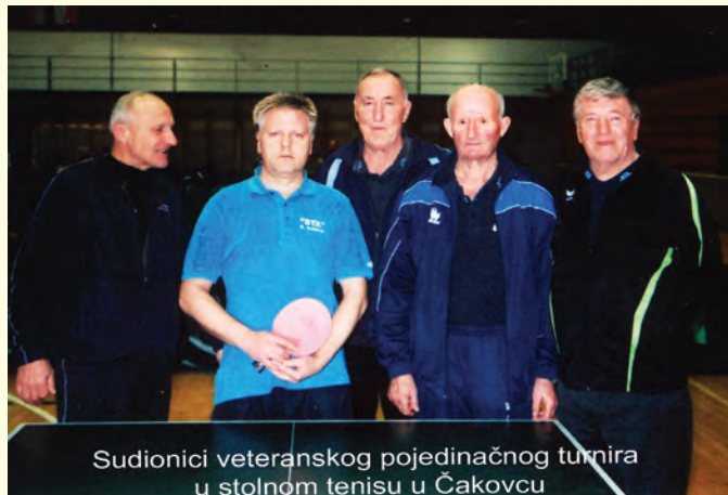
Sudionici veteranskog pojedinačnog turnira u stolnom tenisu u Čakovcu