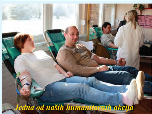
Jedna od naših humanitarnih akcija