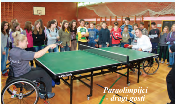
Paraolimpijci - dragi gosti

potrebnih elemenata u električnu instalaciju svih škola te popravak klupa, stolica i katedri uloženo je novih 15.000 kuna. Nabava sredstava i pomagala za nastavu, informatičke opreme te novog namještaja nije stala – od rujna do danas uloženo je 63.657 kuna. U nove sustave i pomagala ulaze se trenutno oko 30.000 kuna. S obzirom da imamo tri velike zgrade, a malo učenika (a time i malo sredstava na raspolaganju), sigurno se pitate kako to uspijevamo. Odgovaramo: naši učenici i djelatnici to su zaslužili pa upravi Škole nije teško brinuti o nabavi sredstava, dobro gospodariti i na kraju svi zajedno čuvati to što imamo. Naše rezultate, način našeg rada, primanje i trošenje sredstava – sve javno objavljujemo. Zahvaljujemo svima koji nam pomažu - u nama su našli dobrog prijatelja i partnera!