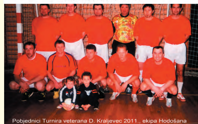
Pobjednici Turnira veterana D. Kraljevca 2011., ekipa Hodošana

Sportska godina nastavljen je ponovnim oživljavanjem ljetne mort sezone s Turnirom ulica. Podsjetimo se da je Donji Kraljevec bio prvi u organizaciji takvog natjecanja u Međimurju 1991., kao i malonogometnog 1966. Glavni pokretač i nosilac iz tog bio je Dubravko Mišćin sa svojim veteranima. Na turniru je sudjelovalo 8 ekipa (ulica). Igralo se bod sistemom (svaki sa svakim) vikendima 5. i 7. pa 15. i 16. srpnja po zaista prekrasnom vremenu u večernjim satima uz bogato jelo i pilo. Nakon žustrih, burnih i nadasve zanimljivih utakmica, plasman ekipa izgledao je ovako: 1. mjesto osvojila je ekipa Centra, 2. mjesto Mlinska-zgrade, 3. mjesto Cvjetna- Murska, 4. mjesto Gornji kraj, 5. mjesto Bikeš-Grobljanska-Prečanec, 6. mjesto Augusta Šenoa, 7. mjesto Ludbreška-Zdenci i posljednje mjesto Čakovečka-Kralja Tomislava. Najboljim strijelcem proglašen je Nikola Hobor sa 12 pogodaka, najboljim golmanom Antun Vargec i najbrojnijom ekipom Bikeš-Grobljanska-Prečanec. Fešta je završila sa revijalnom utakmicom, podjelom priznanja i druženjem sve do zore. (Vilko Šerčer)