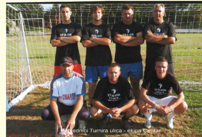
Pobjednici Turnira ulica - ekipa Centar

Dana 6. kolovoza na sportskim terenima u Donjem Pustakovcu pred više od 400 posjetitelja odigrao se Malonogometni turnir naselja Općine . Predsjednici Vijeća mjesnih odbora naselja iz naše općine okupili su najbolje igrače među svojim mještanima da brane boje svog sela. Na turniru su nastupili predstavnici naselja Sveti Juraj u Trnju, Hodošan, Donji Hrašćan, Donji Kraljevec te Donji Pustakovec, jedino se ekipa Palinovca nije odazvala. Za treće mjesto igrali su Hodošan i Sveti Juraj u Trnju, a pobijedila je ekipa Hodošana te tako osvojila treće mjesto. U finalu su se srele, kao o prošle godine, ekipe Donjeg Kraljevca i Donjeg Pustakovca. U vrlo neizvjesnoj utakmici pobijedila je ekipa Donjeg Kraljevca te tako drugu godinu zaredom osvojila Malonogometni turnir između naselja Općine Donji Kraljevec. Titula najboljeg strijelca turnira pripala je Stivenu Samariji , igraču Donjeg Kraljevca sa 7 postignutih golova. Tijekom malonogometnog turnira, ali i dugo u noć, sve posjetitelje zabavljao je glazbeni sastav „Noćna smjena“. Posebno je veselo bilo za vrijeme nastupa popularnog Đure z Međimurja koji je sve okupljene nasmijao do suza. Održana je i tombola čija je glavna nagrada bio sedmodnevni odmor na moru, koju je poklonio naš mještanin Ivica Srnec.